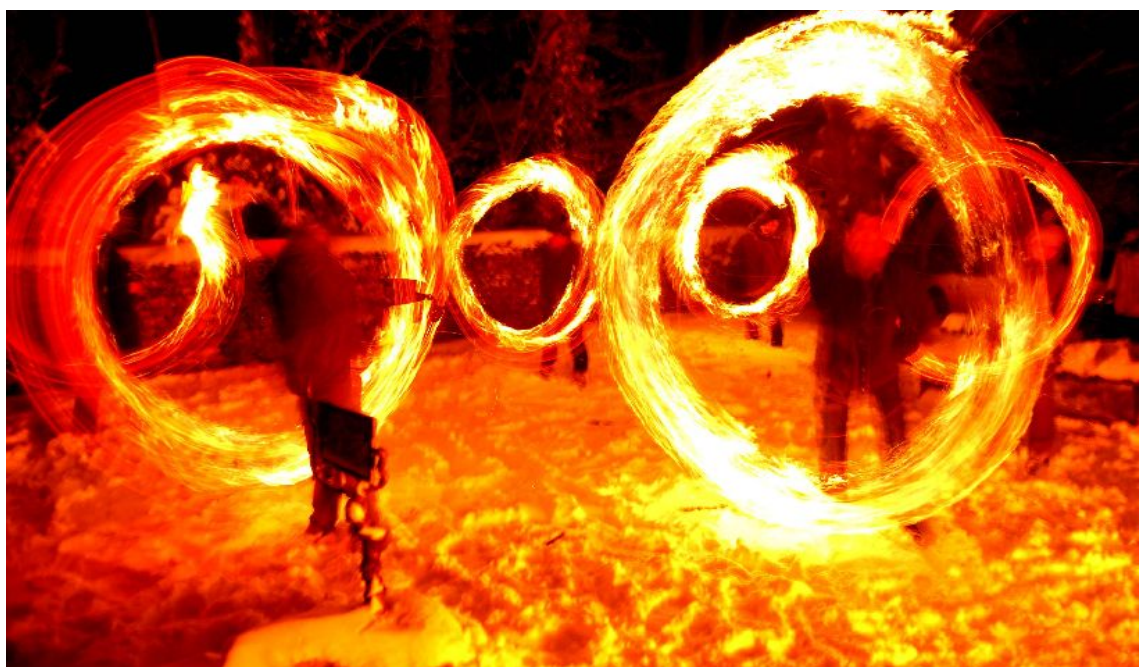
Photo : les fayes du 25 décembre 2010